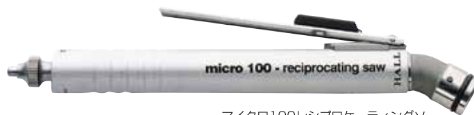
マイクロ100レシプロケーティングソー カタログNo. 00-5053-010-00