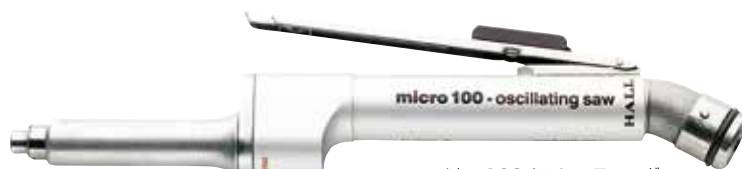
マイクロ100オシレーティングソー カタログNo. 00-5053-012-00 レンチ付