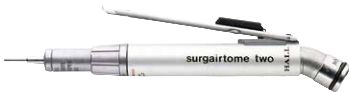
サージエアトームⅡ カタログNo. 00-5058-001-00