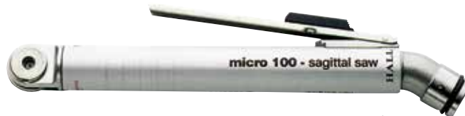
マイクロ100 サジタルソー カタログNo. 00-5053-011-00 レンチ付