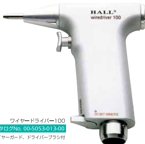
ワイヤードライバー100 カタログNo. 00-5053-013-00 ワイヤーガード、ドライバーブラシ付

スピード：1,100rpm トルク：30インチ・オンス ワイヤー把持径：0.7mm～1.6mm