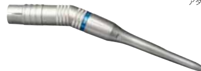
アングルアタッチメント 20° XL (HALL/バー推奨) カタログNo. 11-1375-033-00