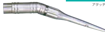
スプレー付き EX20° XL(ミノスタイプ) (3M/バー推奨)