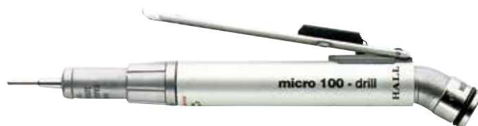
マイクロ100ドリル カタログNo. 00-5053-009-00